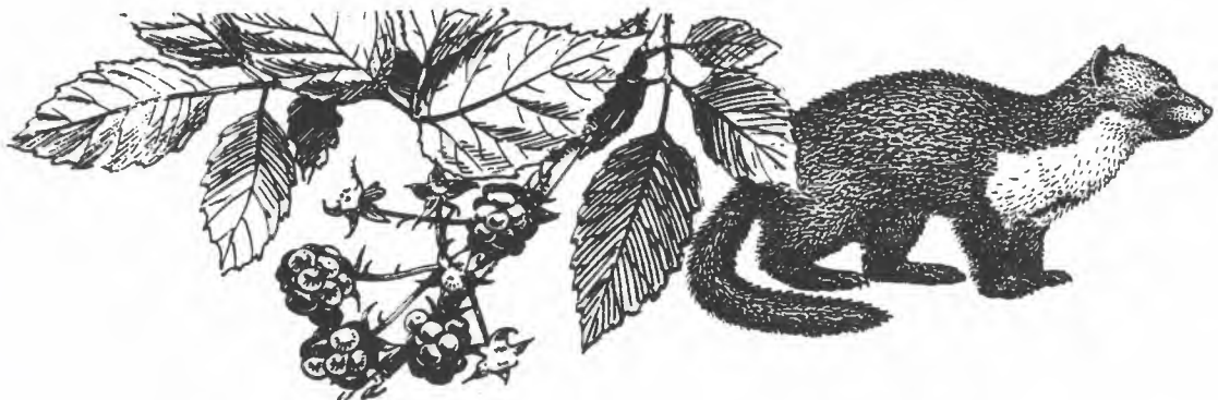
Een Steenmarter steekt voor ons een pad over.