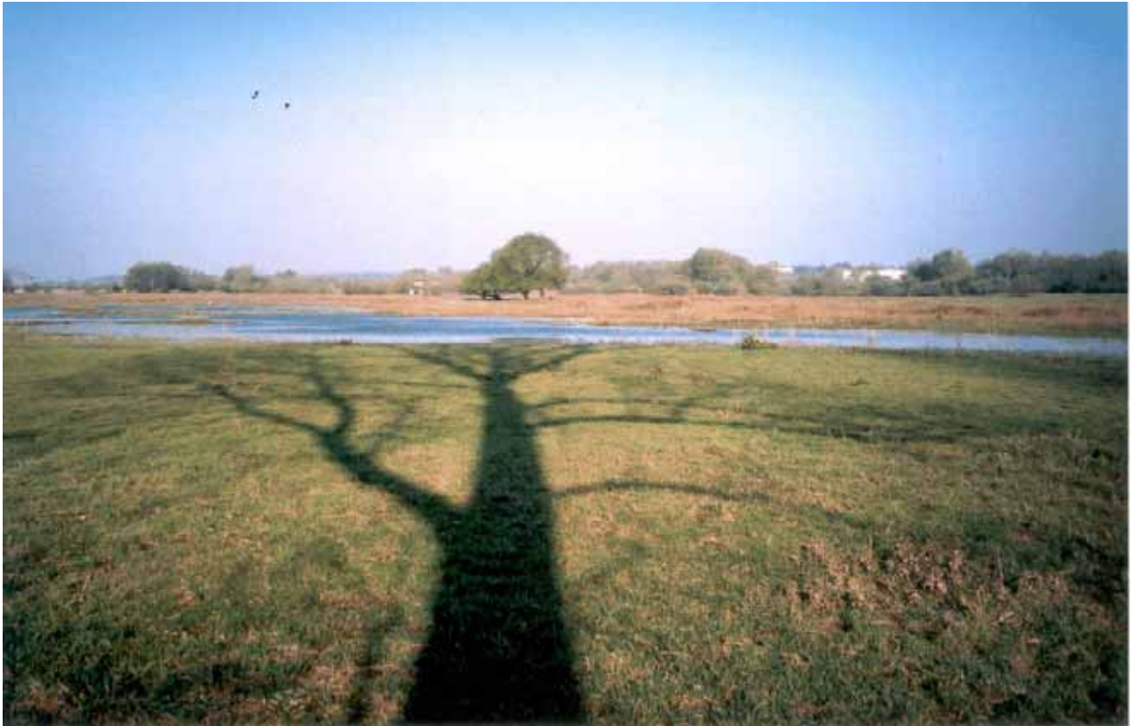
Foto. Meinerswijk, uitzicht op Centrale Vlake, maart 2002

Meinerswijk is met 34 procent van de waarnemingen (15 procent van de vogels) ietwat oververtegenwoordigd in het materiaal. Hier wordt door enkele waarnemers in de goede tijd vaak gericht gezocht naar de soort.