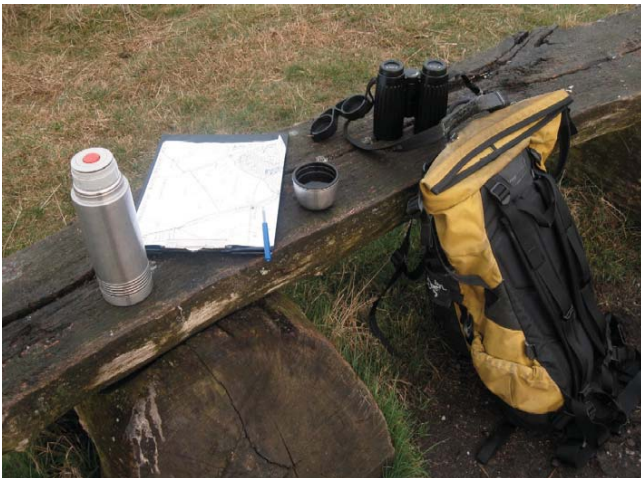
Attributen voor veldwerk (let op de koffie!)

riode werden voor het eerst Grote Zilverreigers slapend op ijs waargenomen op een nieuwe slaappleats in het Duivense Broek, pal langs de snelweg A12.