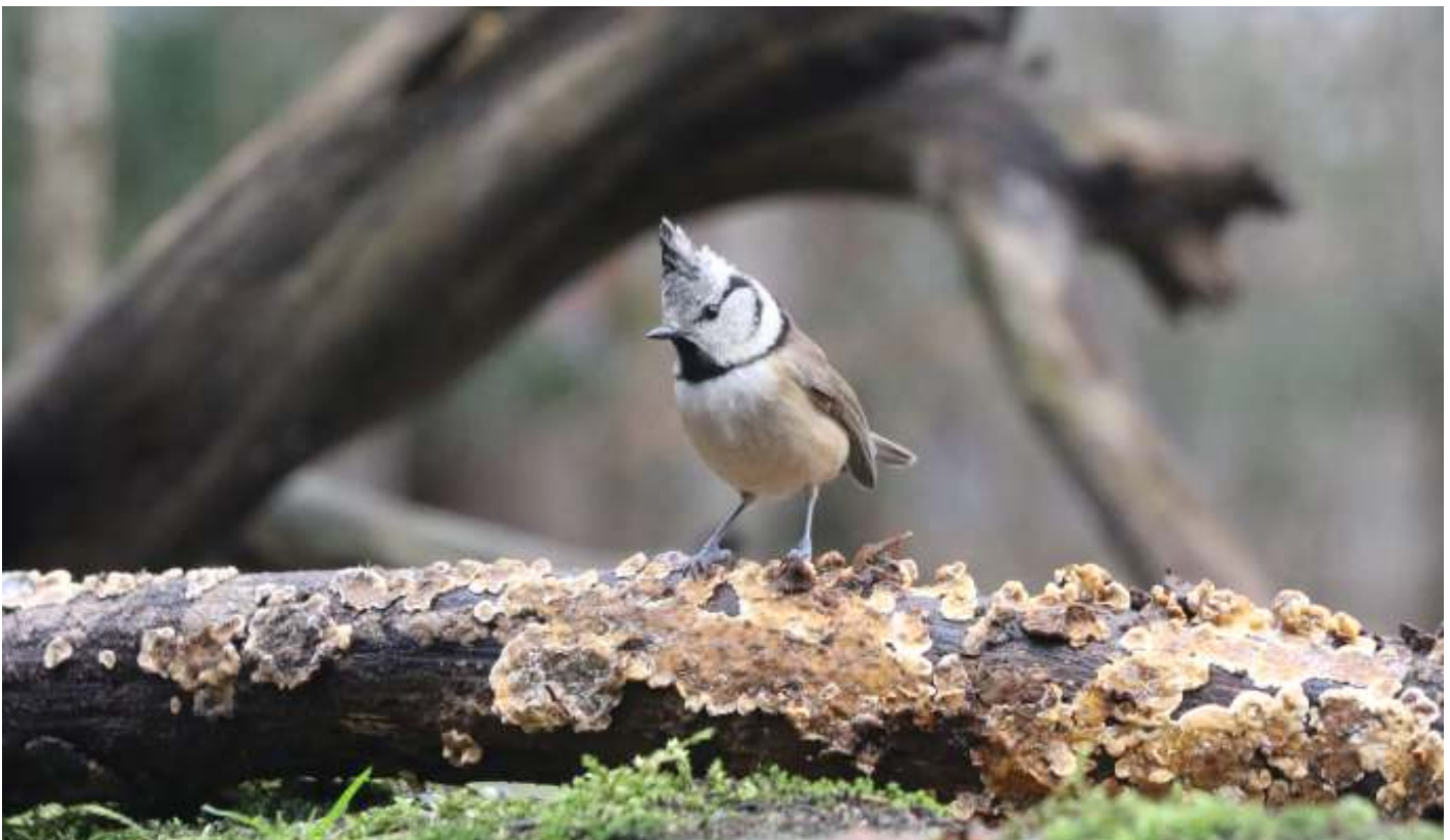
De Kuifmees was één van de gehoorde, maar helaas niet geziene vogels