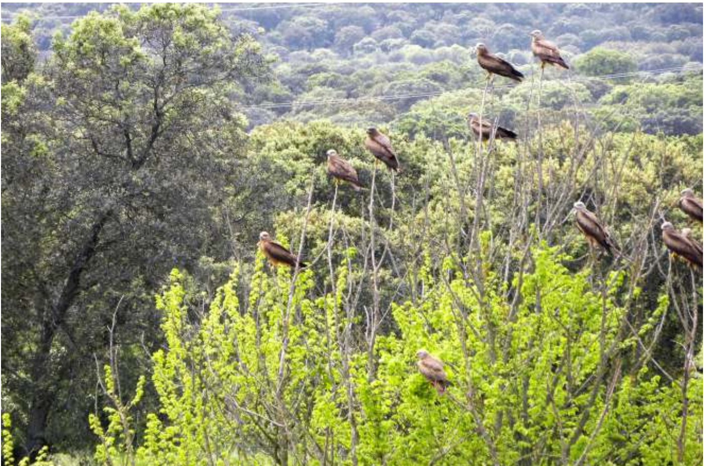
Grote groep Zwarte Wouwen