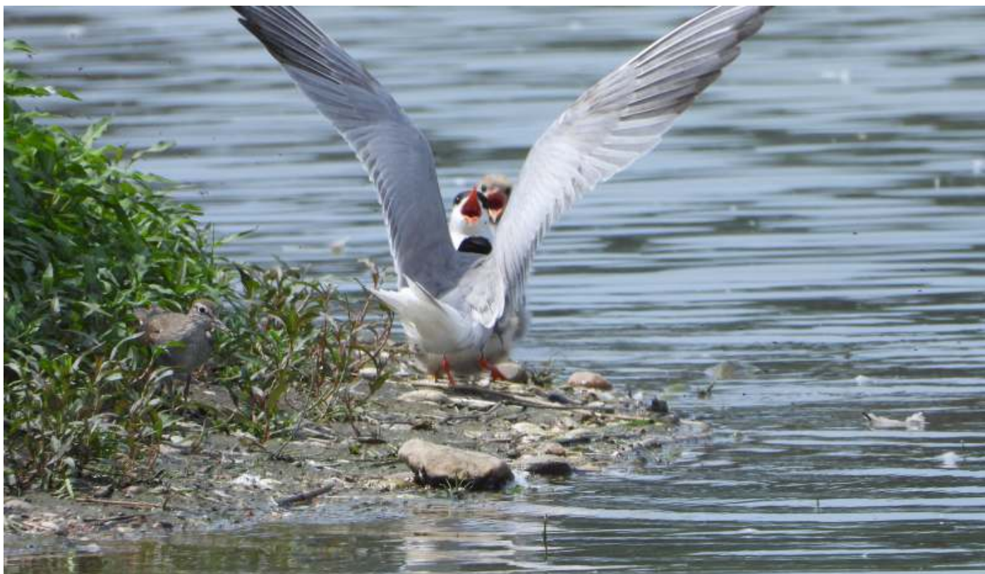
En hier doen we het allemaal voor!!! Visdieven en Oeverloper