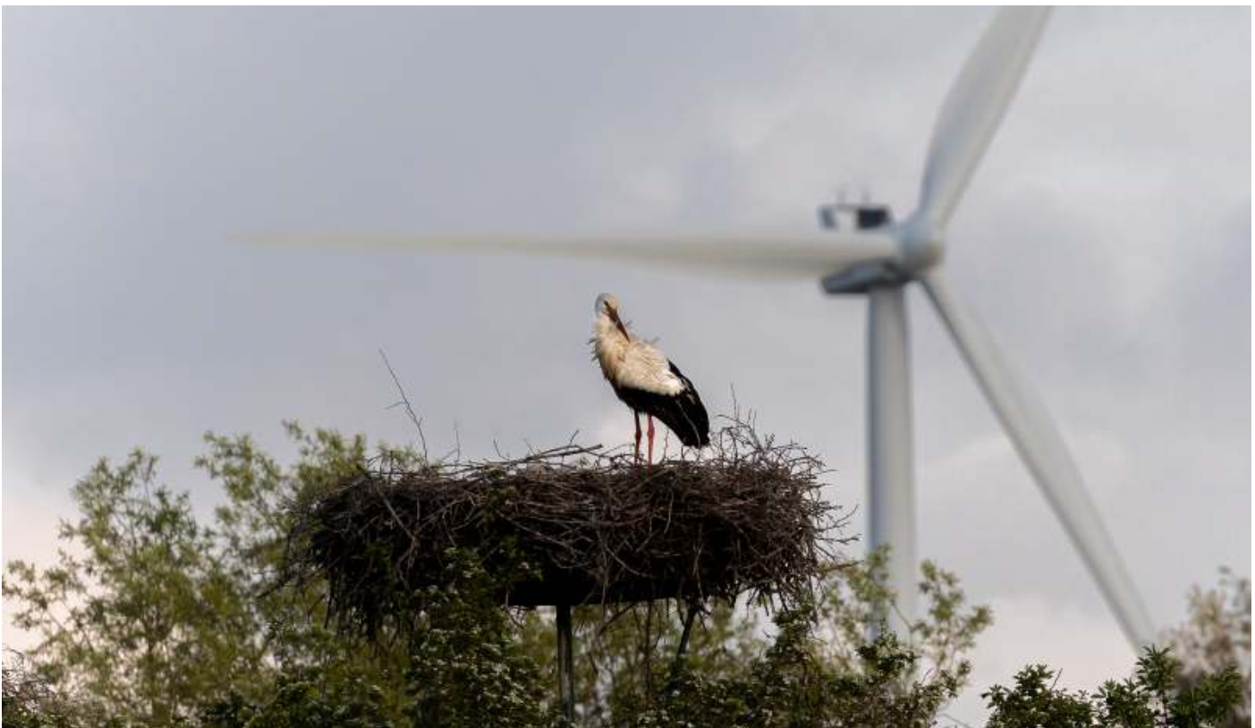
Ooievaar in de Velperwaarden

Over nieuwe zaken gesproken: op de ALV van 2022 staat het agendapunt bestuursverkiezingen genoteerd. In het voorwoord van de voorzitter valt te lezen hoe het met de huidige bestuursleden gesteld is, maar nu maar weer eens de vacatures. We doen het al geruime tijd zonder een bestuurslid onderzoek en bescherming en een bestuurslid lezingen. Voor de eerste functie is een behoorlijke kennis van de vogelwereld gewenst en voor de tweede vooral enthousiaste nieuwgierigheid. Omdat wij, 350 vogelaars!, die eigenschappen allemaal in meer of mindere mate bezitten, moet het toch niet al te moeilijk zijn om deze functies te vervullen. Houd dus de ALV-stukken van straks in de gaten om een geweldige carrièresprong te maken. Nu we toch bezig zijn: zeer onlangs heeft top-vogelaar Jan Schoppers laten weten, dat hij al na 31 jaar wil stoppen als redactielid van de Vlerk. Onze huilbuien zijn net voorbij en nu maar afwachten of hij zelf met een opvolger/-ster komt of wij moeten gaan werven. Als je bij de 95 % van de enthousiaste Vlerklezers behoort, is meer aanbeveling overbodig.