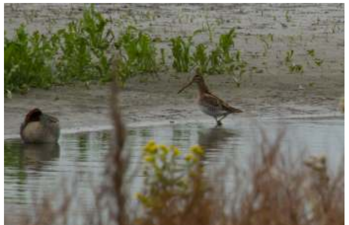
Watersnip en slapende Wintertaling

Zo ook Wintertalingen. Op een plas leken er wel honderden te zitten. Verder zagen we nog gewone Grutto's en Rosse Grutto's, Bonte Strandlopers en een vogel waarvan we nog steeds niet weten of het een Kempphaan was (volgens sommigen én volgens de automatische validator van Waarneming) of een Kanoet (volgens anderen). Helaas is er geen foto van deze vogel aanwezig. Voor de plantenliefhebbers was er eveneens veel moois te beleven.