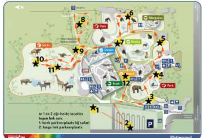
Plattegrond met telpunten

De methode om te tellen/ inventariseren zou een afgeleide van een MUS (Meetpunt Urbane Soorten) telling worden: op twaalf plekken in het park en de parkeerplaats, zou door de drie groepen steeds vijf minuten geïnventariseerd/geteld worden