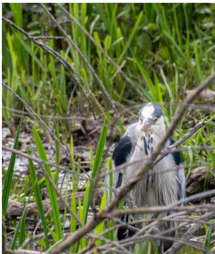
Lepelaar en Blauwe Reiger