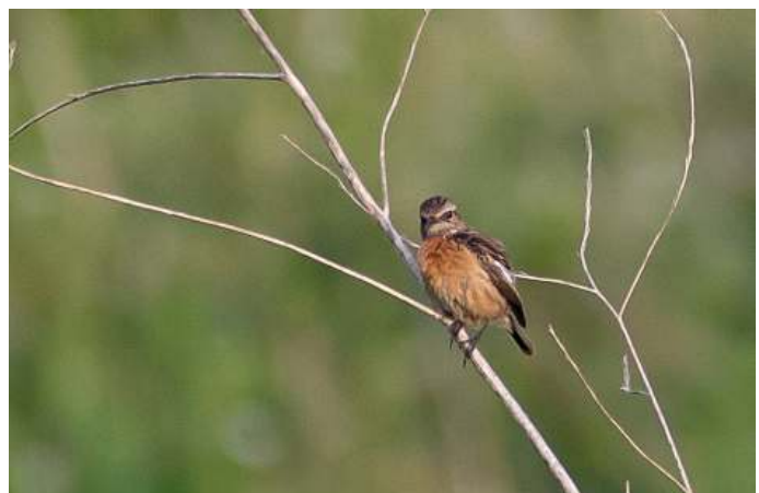
Grote Canadese Ganzen en Roodborsttapuit