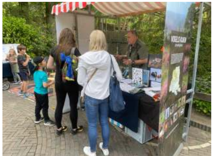
De stand van Vogelwerkgroep Arnhem e.o.

Gelukkig waren er nog wel info folders en met een aantal mooie vogelboeken, een nieuw VWG-tafelkleed en vogelknuffels voor de kinderen, werd de infotafel tijdens BuurNatuur aangekleed en het bleek ook uitnodigend genoeg om tot waardevolle gesprekken aanleiding te geven. Wat dat betreft was het wel: missie geslaagd! Oh, en niet te vergeten; Koos Dansen stelde prachtige vogelfoto's ter beschikking, die ook op de stand te zien waren!!