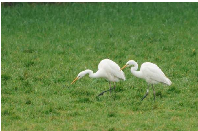
Grote Zilverreiger wit PC63, Pannerden. 15 december 2021.

Op 15 december 2021 lukte het Olaf om deze gekleurde Grote Zilverreiger af te lezen bij Pannerden. In de winter bezoeken veel buitenlandse zilverreigers ons land om te overwinteren, dus spannend waar die is geringd. De vogel is maar liefst 1351 km verderop geringd als nestjong samen met twee andere jongen, eind mei in Litouwen van datzelfde jaar. Dat was bij het meer Alausas gelegen een kleine 10 km ten NO van stadje Utena in het noordoostelijk deel van het land. Het was de eerste terugmelding van deze vogel. Terugmeldingen in ons land van in het buitenland geringde vogels zijn op slechts ruim drie handen te tellen (VogeltrekAtlas.nl): Finland en Letland beide 1, Litouwen 2, Belarus 4, Polen 2, Hongarije 3, Denemarken 1 en Frankrijk 2. Hieruit blijkt dat de Grote Zilverreiger die bij ons in de winter rondstappen op zoek naar muizen vooral een oostelijke herkomst hebben. Zie je de komende maanden een Grote Zilverreiger kijk dan ook of de vogel een kleuring draagt en lees die af.