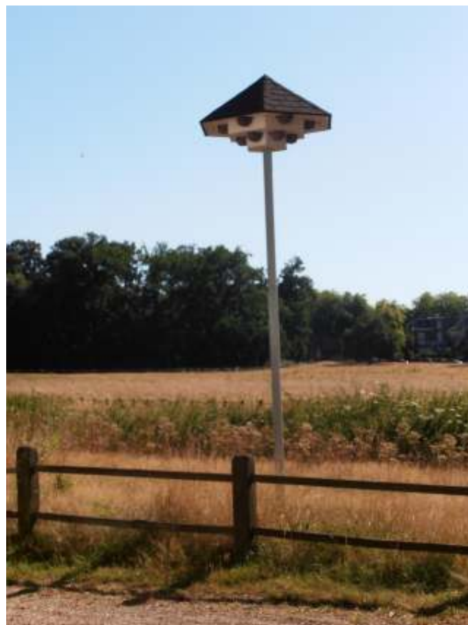
Huiszwaluwtil Sonsbeek.

Redactie Vlerk 2020. Huiszwaluwtil Sonsbeek. Vlerk 37: 91. Spaans A. 2021. Huiszwaluwen rond Sonsbeek doen het best goed. Vlerk 38: 17-18.