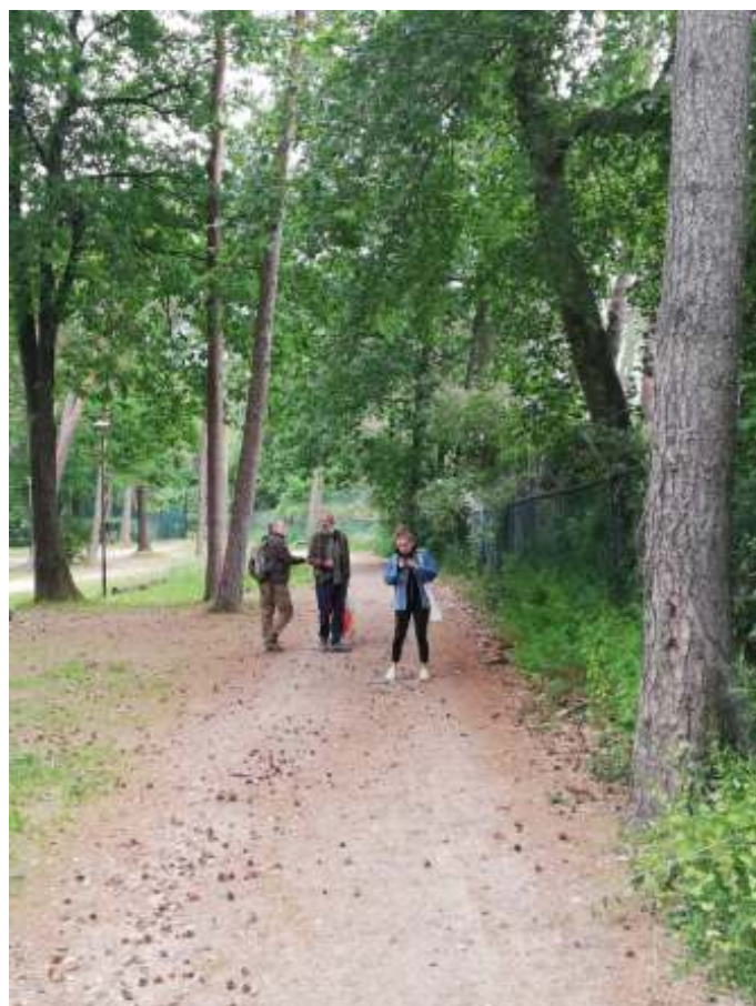
Opnieuw tellers in actie!