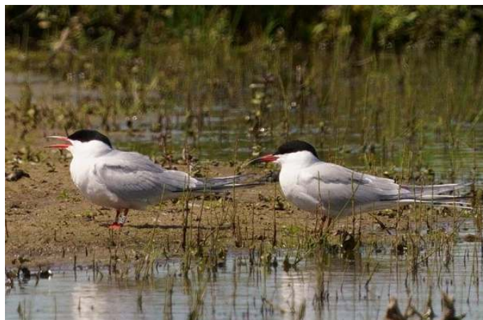
Visdief wit 24L, Kleine Gelderse Waard, Aerdt. 11 mei 2022.

De vogel is op 9 juni 2018 geringd op het broedeiland in Park Lingenzege door Jeroen Nagtegaal. In de uitdraai van CR-Birding wordt geen leeftijd weergegeven. Na een jaar geen aflezingen zijn er in juli 2020 als 2021 een aantal aflezingen in de Putten bij Camperduin (NH). Verrassend is dat de vogel een klein jaar later op 11 mei 2022 door Olaf wordt afgelezen in de Kleine Gelderse Waard. In het eerste levensjaar overlijden relatief veel Visdieven. Vanaf het tweede jaar wordt de sterftkans aanzienlijk kleiner. De gemiddelde leeftijd van de Visdief is 3.7 jaar, terwijl relatief veel vogels wel 12 jaar oud worden. Nog hogere leeftijden zijn schaarser. De oudste drie zijn maar liefst 26.1, 29.0 en 36.4 jaar en alle drie levend en gezond weer losgelaten ... (VogeltrekAtlas).