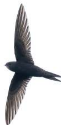
Links: Tuinfluiter en rechts: Gierzwaluw