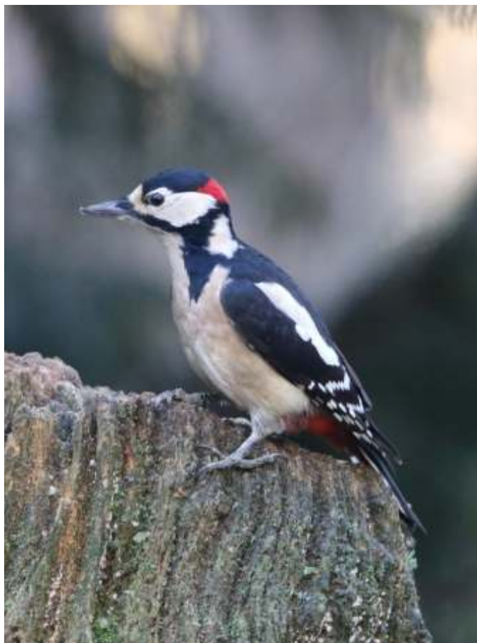
Grote Bonte Specht